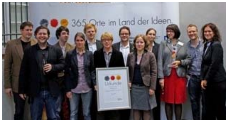
Das Organisationsteam des 2. H-DiS 2010

Zum zweiten Mal veranstaltete das Forum für internationale Sicherheit (FiS) vom 23. bis 25. September 2010 den Heidelberger Dialog zur internationalen Sicherheit, der eine Plattform für Studierende, ExpertInnen, WissenschaftlerInnen und Praktiker bietet, um die für Frieden und Sicherheit aktuellen Themen und Fragen zu diskutieren. Im Zentrum der diesjährigen, durch die ZEIT-Stiftung Ebelin und Gerd Bucerius und die Universität Heidelberg geförderten, dreitägigen Veranstaltung stand die Frage nach den Möglichkeiten und Hindernissen praktischer Politik hinsichtlich externer militärischer Interventionen. Im Konkreten wurde dabei auf die internationale Intervention in Afghanistan und mögliche Exit-Optionen Bezug genommen.